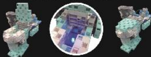
開く → 洗浄する → 閉まる

この講座では「身近なモノ」にスポットをあてて 取り扱います。例えば、ふたが自動開閉する、 洗浄機能つぎトイレです。 タッチセンサーの利用方法や、機能する条件などを学び、組み 立ててプログラミングします。実際に使われているモノだから こそ、目に触れないモノ(センサーなど)にまで、深い興味が持 てるようになるのです。 そしてトイレ、自動ドア、人感センサーライト...、普段からいるい ろんなものに対して「なぜ?」が生まれてくるのです。